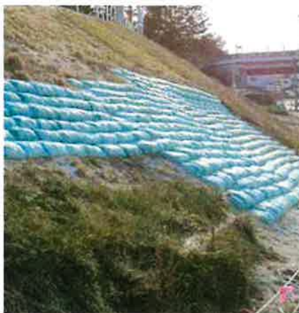
法面崩壊部分の埋戻し