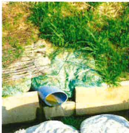
湧水箇所の崩壊防止