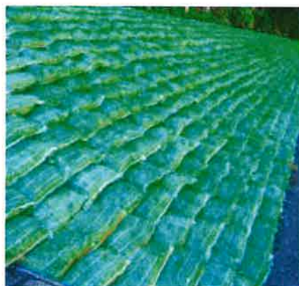
土留グリーンバッグ工