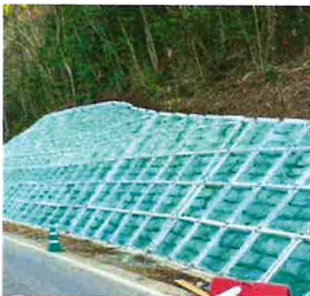
法枠グリーンバッグ工